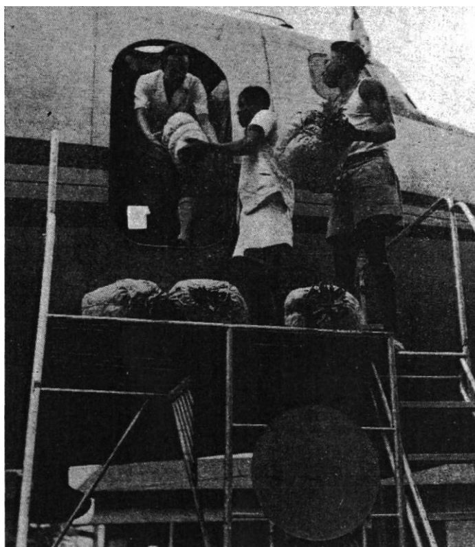
TRAVAIL A LA CHAÎNE POUR L'EMBARQUEMENT EN AVION.

Bien sûr, les grands alignements des plants sont imposants par leur régularité et l'aspect des terrains ainsi plantés, mais en profane artiste, j'ai préféré les coins moins soignés, et dégingolant dans les cailloux, laissant de « séréal » dans les ronces qui défont fruits, ces ronces qui enrobent tout, les souches d'arbres pourris sur place, les lierres jeunes plants, cachent les serpents, mais donne au visiteur une impression de végétation puissante et de mystère. (Suite p