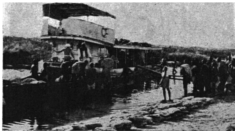
L'ÉMILE-GENTIL A L'ACCOSTAGE.

le Cameroun et le territoire du Tchad. Sur la rive gauche, nous passons devant Goulfaï, petite ville fortifiée dont les remparts et la porte de style arabe, existent encore et où se réunirent en février 1900 les missions sahariennes, avec