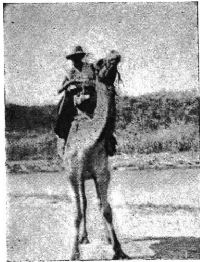
M.. DAUMONT A BAGA-SOLA.

ou trois cents mètres en aval et recommencent. Il est difficile de dépeindre la poésie de ce travail collectif sous la lune.